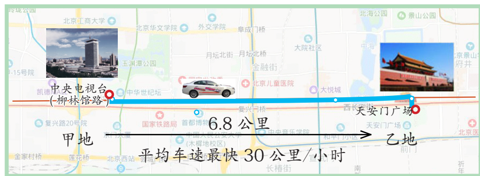
央视大楼到天安门广场路线图

妈妈带我到医院，抱起我就往急诊室跑，挂了号，医生查了好一会儿也查不出病因，就说：“先去化验、做做B超、再做一个CT，然后拿我这儿确诊。”