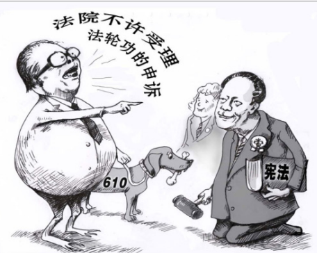
宪法成家奴？ 2005.2.17 三警