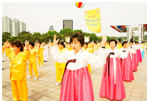
◀韩国首尔法轮功学员集体炼功。韩国已有数万人修炼法轮功。

虽然没有关于法轮功是如何进入朝鲜的官方记录，但消息人士表示，这是由平壤的贸易官员传