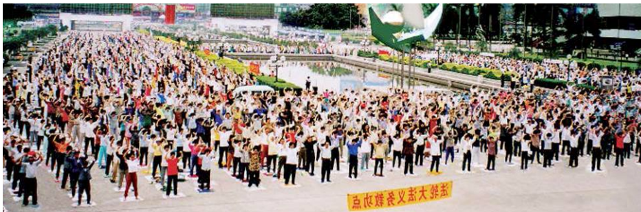
▲1999 年 7 月法轮功被迫害后，有成千上万法轮功学员去北京上访，为了不连累单位和家庭，众多上访的法轮功学员被关押后，因不报姓名而失踪。图为 1998 年广州一个法轮功炼功点的学员们在晨炼。

中共强摘器官有两个原因：消灭让（中共）讨厌的少数群体，并获得巨额利润。中国的器官移植流水线不仅仅是谋杀，也可能是一种群体灭绝。◇