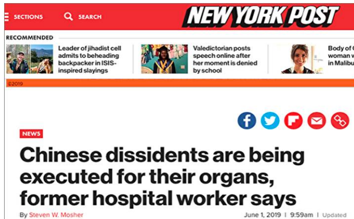
《纽约邮报》 文章网站截图

象乔治这样亲眼目睹活摘器官的情况非常罕见。去中国的“移植游客”不会被告知他们的新心脏、肝脏或肾脏来自哪里。那些器官被