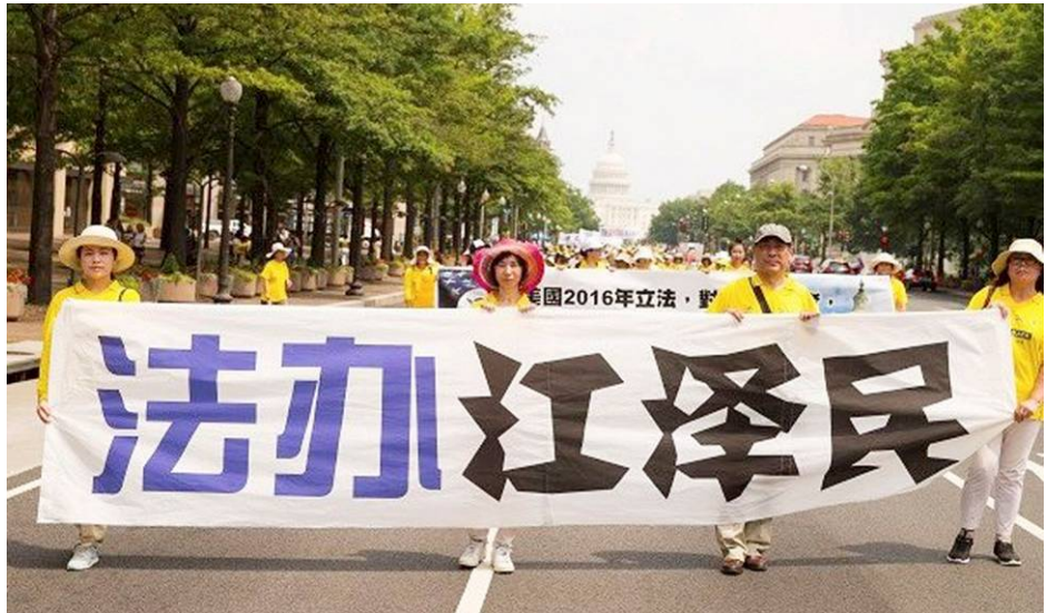
▲1999 年 7 月 20 日，中共前党魁江泽民祸国殃民，发动了对法轮功学员的残酷迫害，其罪行必将被清算。

1998 年，江泽民在一次洪灾期间外出视察，在一处大堤看到一群人在埋头苦干。江很得意，对随行的人说：这些人一定是共产党员。不料，经过询问，原来他们都是炼法轮功的。江泽民听到答复后，阴着脸掉头走开了。