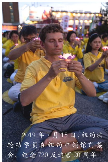
2019年7月15日，纽约法轮功学员在纽约中领馆前集会、纪念720反迫害20周年

行集会及烛光夜悼，谴责二十年来中共对法轮功学员的血腥打压与残酷迫害。悼念被中共迫害致死的法轮功学员。曝光中共对按真善忍做好人的法轮功学员犯下的滔天罪恶。呼唤正义良知，共同制止迫害！中领馆对面哈德逊河边上，法轮功学员打出“停止迫害法轮功”、“全球控告江泽民”、“法轮大法好”等横幅，他们沿着河岸整齐地席地盘腿而坐，延绵上百米。◇