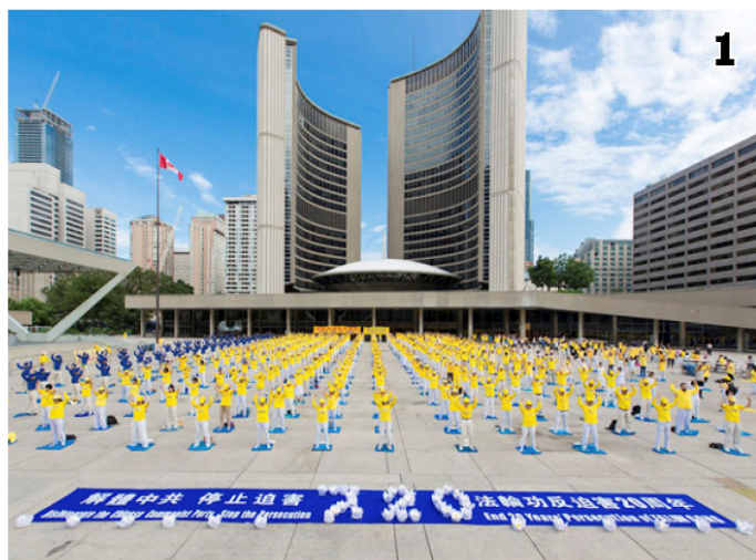
图1：多伦多法轮功学员在市政府广场集体炼功、集会；图2：前加拿大联邦参议员迪尼诺在多伦多反迫害集会上发言；图3：台湾法轮功学员烛光悼念。◇

前加拿大联邦参议员迪尼诺说：“我来参加这集会的一个主要原因，是因为你们的勇气。因为你们的专注和坚持，你们是英雄。”“我很自豪每年都来，不仅是来支持你们，也是为了你们给予我的荣耀，允许我和你们——我钦佩和尊敬的人在一起。”