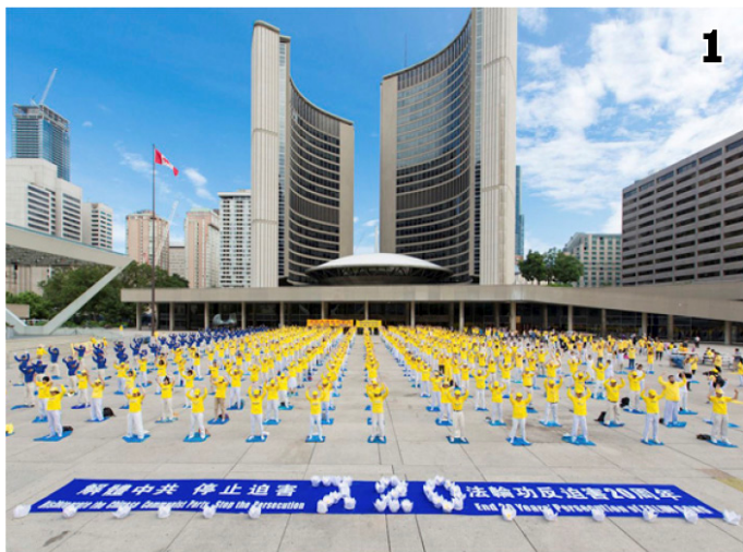
图1：多伦多法轮功学员在市政府广场集体炼功、集会；图2：前加拿大联邦参议员迪尼诺在多伦多反迫害集会上发言；图3：台湾法轮功学员烛光悼念。◇

前加拿大联邦参议员迪尼诺说：“我来参加这集会的一个主要原因，是因为你们的勇气。因为你们的专注和坚持，你们是英雄。”“我很自豪每年都来，不仅是来支持你们，也是为了你们给予我的荣耀，允许我和你们——我钦佩和尊敬的人在一起。”