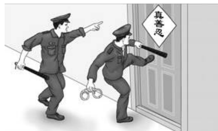
▲漫画：中共警察闯入民宅 绑架法轮功学员

男法轮功学员（约50岁左右），并包围此学员在越秀区鹿景路的住处进行抄家，掠走笔记本电脑、U盘、大法书等私人财物。目前此学员下落情况不明。◇