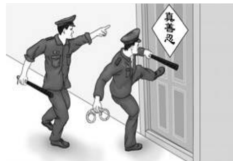
▲漫画：中共警察闯入民宅绑架法轮功学员

然而比起酷刑、屠杀，他认为更让人震惊的是世人可怕的沉默。他直言：“直接面对真相需要真正的勇气，我们必须正视这些极端的邪恶和苦难。他们不会因为你的无视而不存在。恰恰相反，人们的沉默是作恶者日益猖獗的条件。” ◇