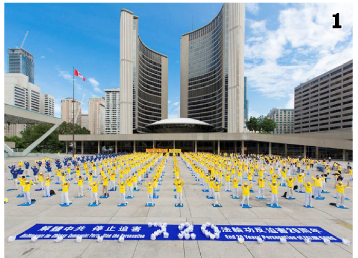
图1：多伦多法轮功学员在市政府广场集体炼功、集会；图2：前加拿大联邦参议员迪尼诺在多伦多反迫害集会上发言；图3：台湾法轮功学员烛光悼念。◇

前加拿大联邦参议员迪尼诺说：“我来参加这集会的一个主要原因，是因为你们的勇气。因为你们的专注和坚持，你们是英雄。”“我很自豪每年都来，不仅是来支持你们，也是为了你们给予我的荣耀，允许我和你们——我钦佩和尊敬的人在一起。”