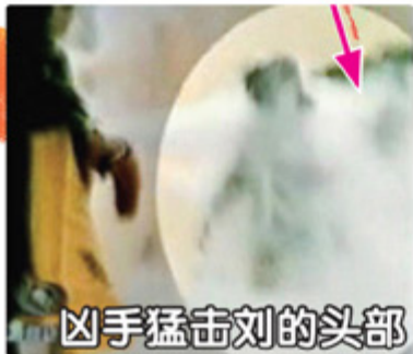
凶手猛击刘的头部