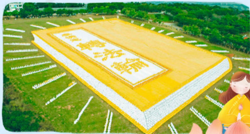
▲ 6000多名法轮功学员在台湾台中市外埔乡排出《转法轮》一书的立体画面，极为壮观。

法轮大法已弘传了100多个国家和地区，受到世界人民的爱戴和尊敬。李洪志先生和法轮大法因对人类身心健康做出的杰出贡献，获各国政府褒奖、支持议案和信函3500多项。《转法轮》已经有40种文字版本，是到现在为止翻译成外国文种最多的中文书籍，可以在法轮大法网站（ falundafa.org ）上免费下载。