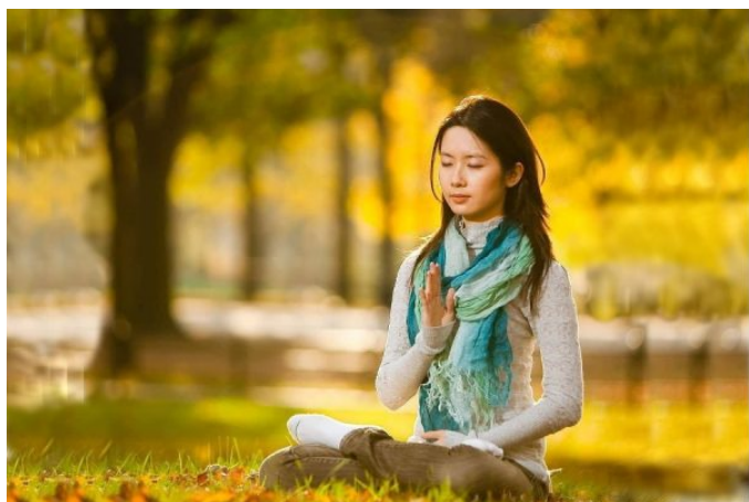
▲法轮功学员在打坐

懂事仁义，全家人身心健康，小区的居民称我们是世界上最幸福的家庭，有什么苦恼事就爱找我说说，同学们生活中有什么烦心事也都来找我倾诉，我用修炼人悟到的理开导他们。一次谈话后，同学说：“我也要好好修炼。”还有一个同学向一个当医生的同学咨询失眠怎么办，医生同学说：“那你就念‘法轮大法好’，你看人家某某（指我）都不生病。”