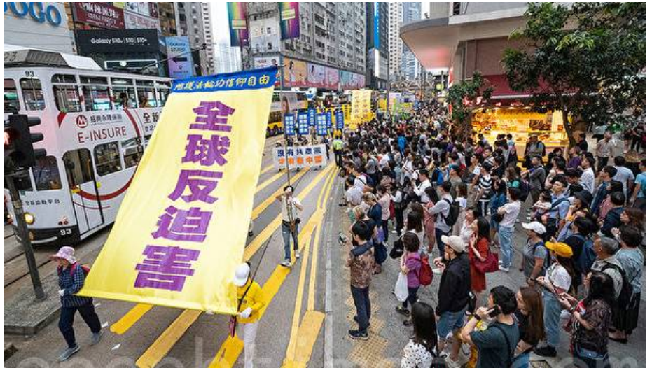
▲2019 年 4 月 27 日，香港法轮功学员举行纪念“四二五”20 周年暨声援三亿三千万人退出中共（党团组织）集会和大游行。

中国问题专家横河先生说，“这是 20 年来首次有国家以政府行政措施对迫害法轮功的主要执行者实施惩罚。这显示，过去 20 年国际上对法轮功反迫害的支持已经从民间国际组织、各国的民选议会、国会的立法和决议，开始进