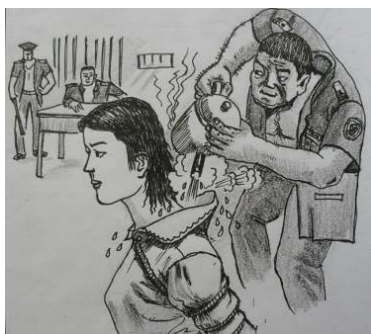
酷刑示意图：热水烫

【明慧网】辽宁省女子监狱位于沈阳市于洪区平罗镇，是辽宁地区迫害女性法轮功学员的黑窝。自一九九九年中共迫害法轮功以来，监狱为了逼迫被非法关押的法轮功学员放弃信仰，对法轮功学员实施的迫害手段极其残忍、令人发指。如：开水浇身、打毒针、电击、灌辣椒水、辣椒皮塞阴道、吊铐、扒光浇凉水、超强奴役等等。