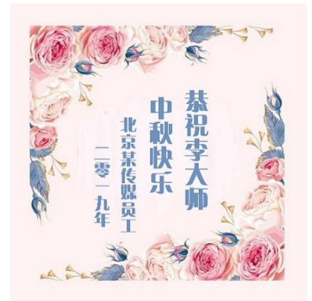
▲北京某传媒员工中秋贺卡

我们员工中,有结婚数年没有孩子,因为退出中共党团组织后,喜得贵子的;有家属出差在宾馆触电,默念“法轮大法好”遇难呈祥的;有出车遇到劫匪,默念“法轮大法好”平安无事的;有采访夜归,遇到抢手机的,默念“法轮大法好”劫匪吓跑的;有刹车失灵,默念“法轮大法