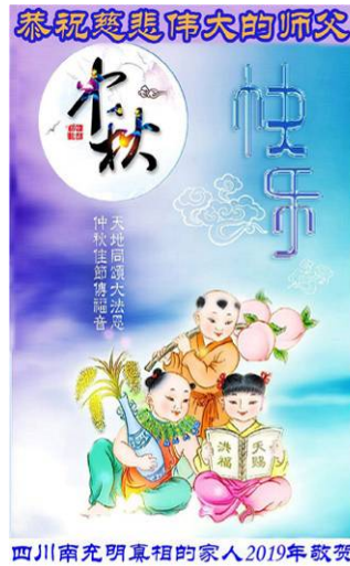
四川南充明真相的家人 2019 年敬贺