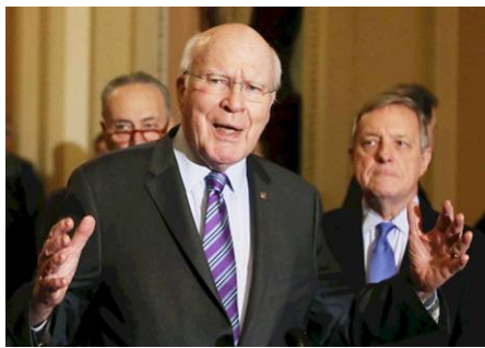
▲美国佛蒙特州联邦参议员莱希

9 月 12 日, 美国佛蒙特州联邦参议员帕特里克·莱希发表声明, 要求中共停止迫害法轮功。莱希的声明已被列入国会记录。莱希参议员指出, 法轮功是中国传统信仰, 法轮功学员打坐炼功, 以“真、善、忍”为指导原则。法轮功学员(在中国)遭受多种酷刑迫害, 并被强摘器官和迫害致死。