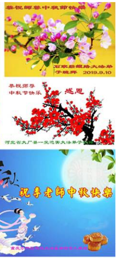
河北省大厂第一实验小学法轮功弟子 敬祝 2019 年中秋快乐