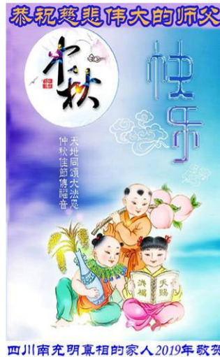
四川南充明真相的家人2019年敬贺