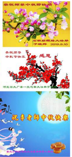
河北省大厂第一实验小学弟子 敬祝 2019年中秋