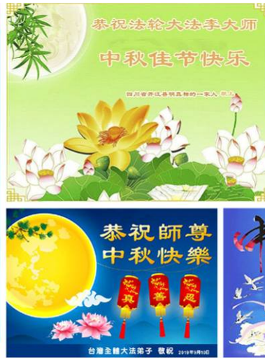
台湾主修大法弟子 敬祝 2019年中秋