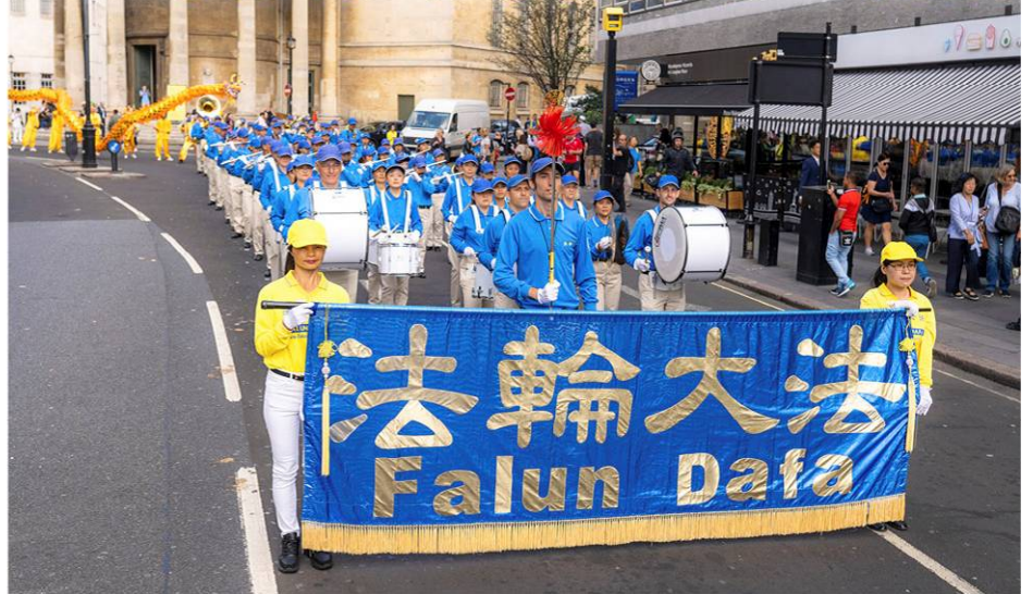
▲ 8 月 30 日，逾千名来自 34 个国家的法轮功学员齐聚英国伦敦举行大游行。图为欧洲天国乐团走在当天大游行最前方。

丹尼斯来自瑞士，她手中拿着一张放在白色花圈中的照片。她介绍说这是一位因为信仰“真、善、忍”而被中共迫害致死的女士。她表示，“也是同样的信仰引领着我来到伦敦，在这里向全世界发声，让人们了解从 1999 年起发生在中