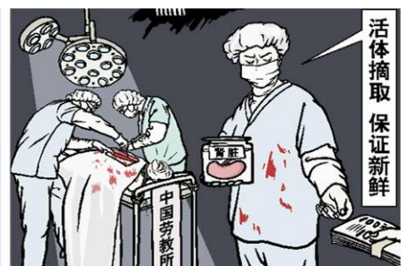
时事漫画：罪恶的交易