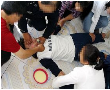
▲酷刑演示：野蛮灌食