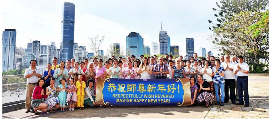
▲昆士兰法轮功学员齐聚袋鼠角公园恭祝法轮功创始人李洪志先生新年好。