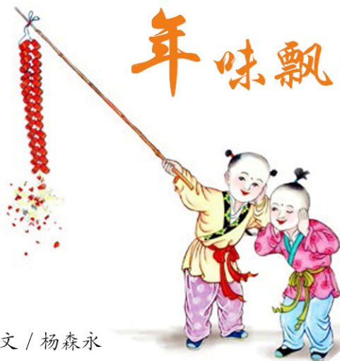
文 / 杨森永

孩提时期最丰满的记忆中，最期盼的就是过年了，因为那样就可以有新衣服穿，有肉吃，还可以不用担心到处玩了以后被骂，更不用