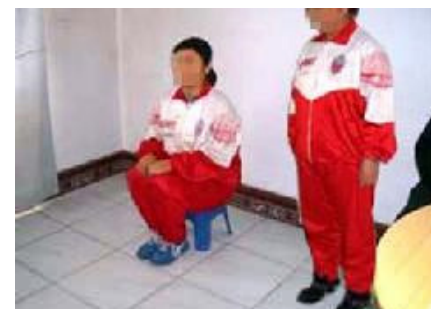
酷刑演示：罚坐小板凳

上述事实表明，这场由被控告人江泽民一手发起的对上亿法轮功学员的迫害，已构成严重的群体灭绝罪、酷刑罪和危害人类罪。为了早日结束这场邪恶的迫害，伸张正义，请予尽快立案侦查，将罪魁祸首江泽民绳之以法。