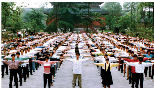
成都法轮功学员集体晨炼的场景。

如果您想了解法轮大法的消息，包括法轮功书籍、功法和法轮功弘传世界的各类消息，请上网查询（方法请参照第5页介绍），学炼法轮大法是免费的，而且来去自由。