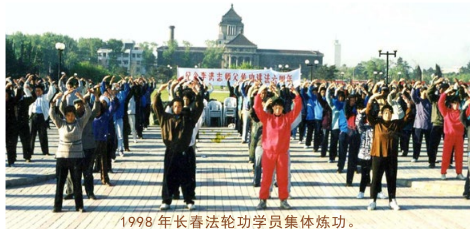
1998 年长春法轮功学员集体炼功。

翻开共产党的历史看一看，自中共暴力夺取政权后，为了维护其统治地位，就是一路地杀人。在短短的几十年中，中国人见证了所谓在“和平环境下”人类历史上最邪恶、最残酷的血腥运动，如