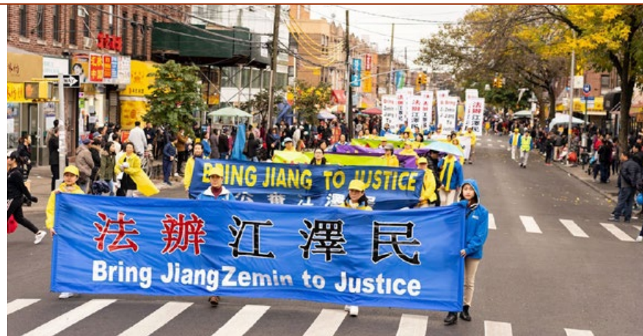
▲ 2019年10月20日，法轮功学员在美国纽约布鲁克林举办盛大游行，呼吁停止迫害法轮功，法办迫害元凶江泽民。

逾20万的法轮功学员及家属向中国最高检察院和最高法院递交了起诉江泽民的刑事控告书。这些控告来自中国的所有省份及海外24个国家，控告人涵盖了中国社会的各阶层、各行业。