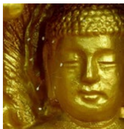
▲ 佛像上的优昙婆罗花