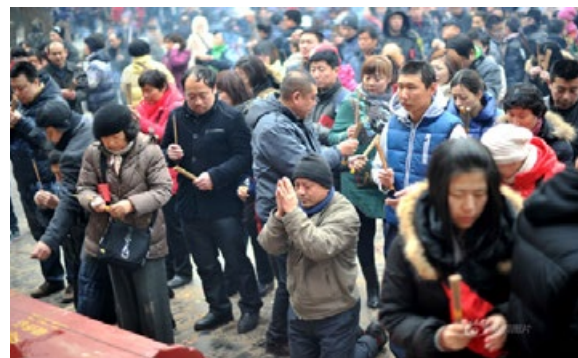
▲ 大年初一北京8万市民赴雍和宫烧“头炷香”。