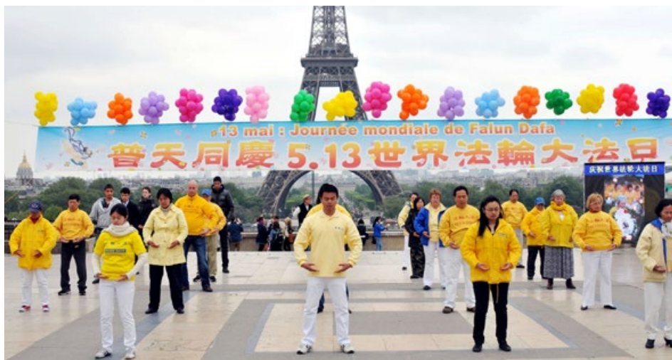
▲ 法国法轮功学员集体炼功。

1995年3月13日，李洪志先生应中国驻法国大使馆邀请，在使馆文化处举办讲法报告会，从此，法轮大法走向世界。