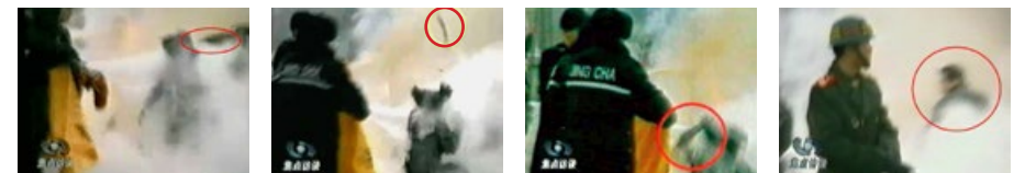
凶手猛击刘的头部 一条状物弹起 触摸被击打部位 凶手刚刚用过力的姿势