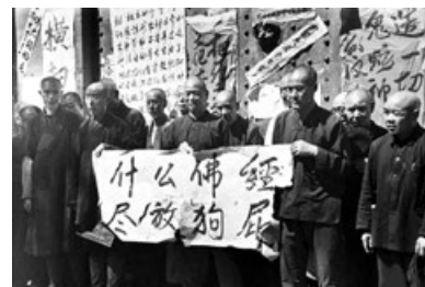
批斗和尚，侮辱信仰。