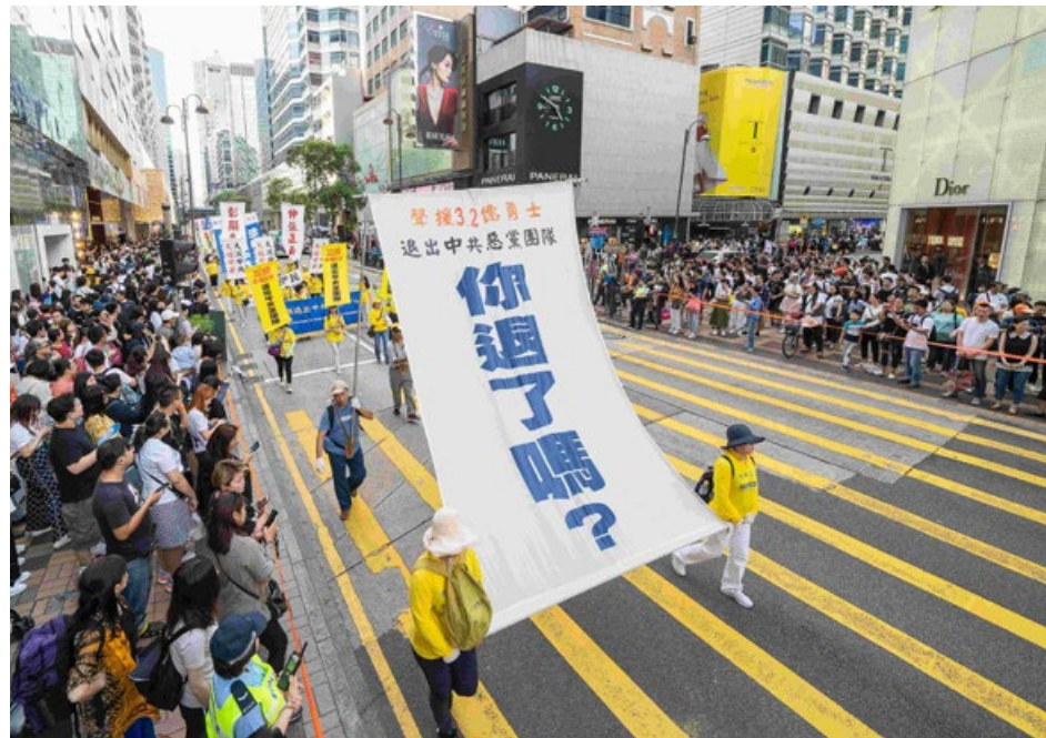
▲ 2019年5月12日，香港法轮功学员举行盛大游行，队伍中法轮功学员举起大型横幅，呼吁大陆民众退出中共党团队。

县长还说：今后我们一定利用工作的方便，帮助法轮功学员。以后，也要劝我们所有的亲戚朋友“三退”，告诉他们千万不要再听信中共谎言的欺骗，我们全家人从内心感谢慈悲伟大的大法师父！法轮大法好！