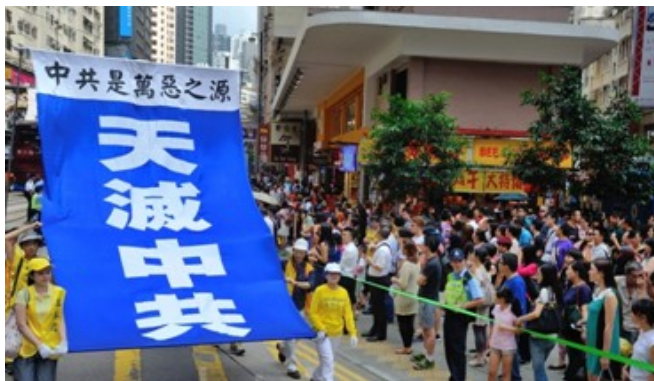
图：2013 年 9 月 1 日香港法轮功学员反迫害大游行，打出“停止迫害法轮功”、“中共是万恶之源”、“天灭中共”等条幅，震撼人心。

四月初，长春市曙光街道社区人员打电话骚扰法轮功学员及家属，说什么完成上级工作，填表、签名保证一些非法要求。◇