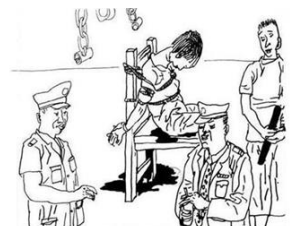
▲中共酷刑示意图：捆绑在椅子上

刚被关押的时候，每天都念法轮大法好，犯人把她绑在椅子上殴打，把抹布塞到嘴里不让她喊，迫害的很厉害。在2019年下半年去医院检查，她头顶上有个大包，住了一阵子医院，出院后每天吃药，头晕，后来精神出了问题。◇