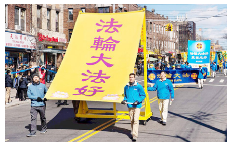
▲海外法轮功学员游行中的巨型横幅

记得第一次我要他们一起小声朗读时，他们却大声读出声来，几乎整栋教学楼都听到了。反正全校师生都知道我是法轮功学员，我也不管了。有些我教过的学生或没任教的学生，校园内外见到我时，不喊“老师好”，而是喊：“法轮大法好”。十几年来，一直都有。