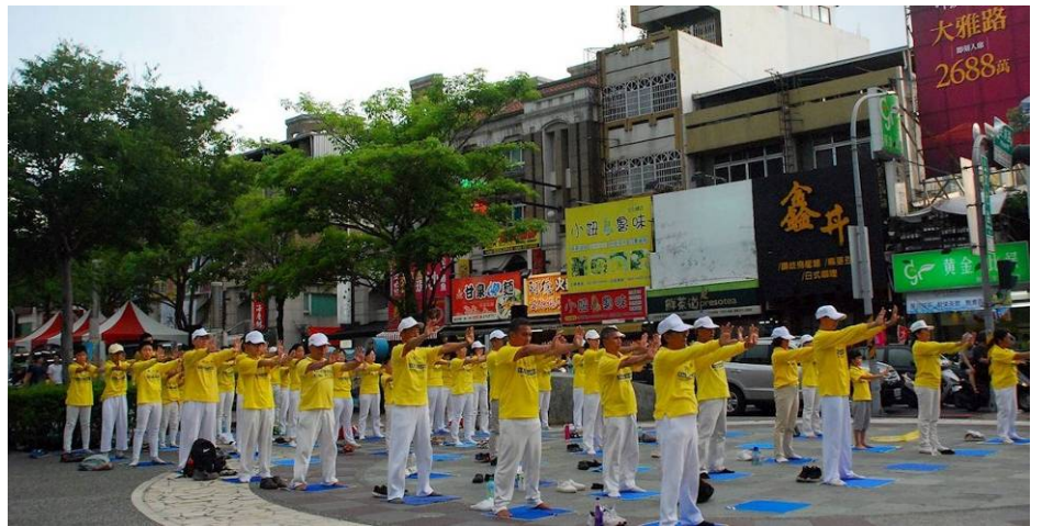
法轮功学员在嘉义市文化公园演练法轮功功法

法轮大法从一九九二年传出已有二十八年，弘传世界一百多个国家和地区，一亿多人通过修炼法轮大法身心受益，数亿法轮功学员的家人和亲友，因为支持大法得到福报，世人认同大法明白真相后，诚念“法轮大法好，真善忍好”得到身心健康，逢凶化吉，遇难呈祥的例子更是层出不穷。