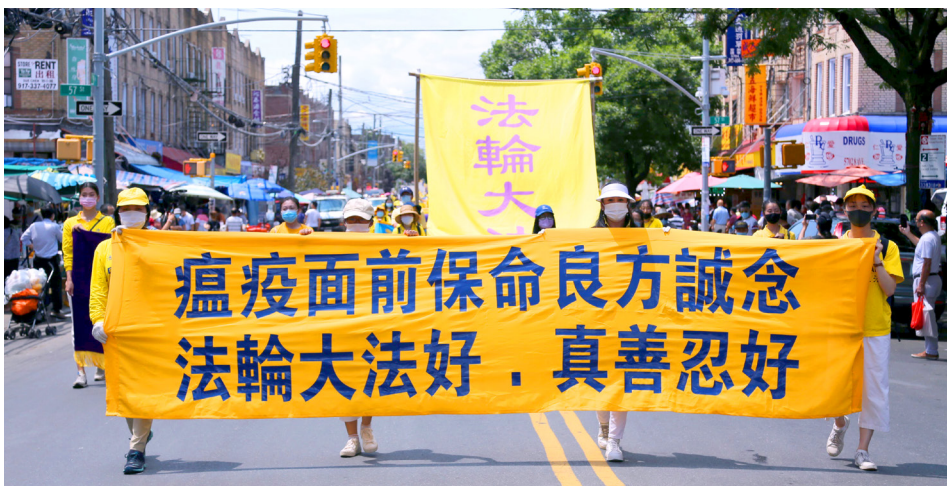
▲ 7月18日，纽约法轮功学员游行，向世人传递避疫良方。

他说：“这次全家死里逃生之后，我对大法有了全新的认识，以前没有那么深入，这一次我是真真切切感受到了法轮大法救了我们全家，这使我对大法坚信不疑，直到现在也在坚持每天炼功和阅读《转法轮》。”