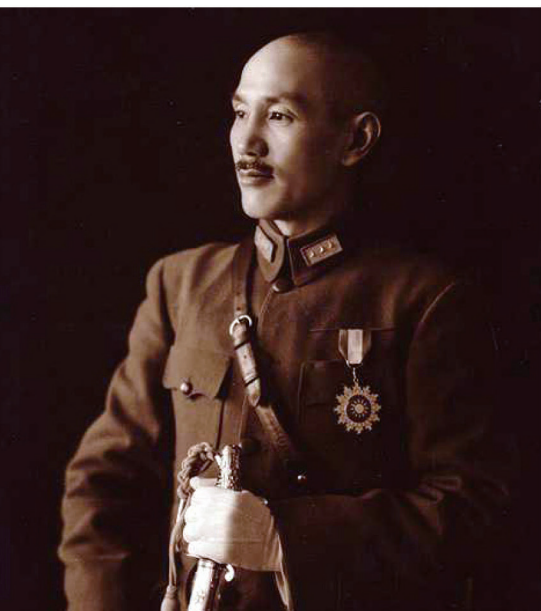
▲ 蒋介石：“现在中国人都相信他们，打没用，等中国人慢慢看清了真相，会期待我们回来的。”

石贴身侍卫回忆：“他伏在桌子上哭得很伤心，一边哭还一边叨咕，不打了，不打了，打来打去死的都是中国人，这是天要亡我，现在中国人都相信他们，打没用，等中国人慢慢看清了真相，会期待我们回来的。”