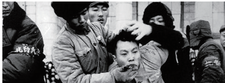
▲ 中共于文化大革命期间枪决“反革命份子”前为使之发不出声音，采用各种残忍手段“消声”。

蒋介石一生不忘“拯救中国”，不是因为他梦想反攻夺权，而是要拯救被中共毒害和毁灭的中国人及中华文明。他早在70年前就洞彻了共产主义及中国共产党的本质，看清它是一个毁灭中国、赤化世界的恶魔。遗憾的是，这一点当时并没有被中国人所知晓，因为中共建政之后屏蔽掉一切对其不利的声音。如今，我们再看蒋介石70年前的精辟分析，铮铮有声，引人深思。■