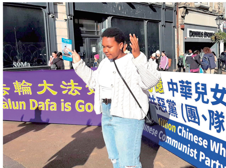
◀ 西人女士尝试法轮功第二套功法，感受到巨大能量。

过过滤的，是假的”，中共设置的网络防火墙，屏蔽了外界的真实消息，以便自己编造假新闻欺骗百姓，中共“每天都在里面对中国人撒谎”。他们当场欣然退出中共组织。