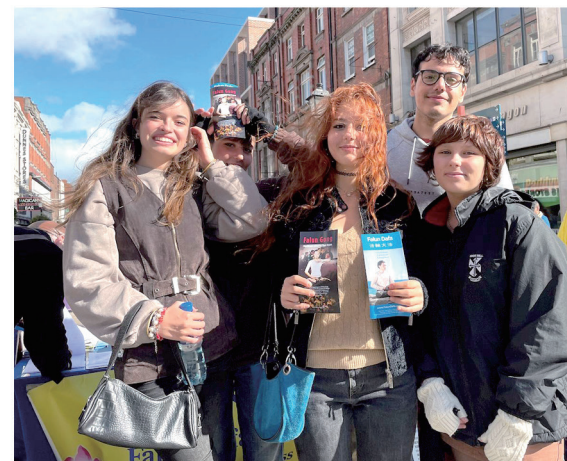
人们阅读展板了解真相，支持法轮功反迫害。