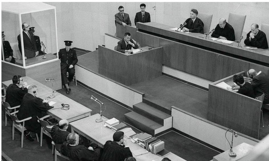
▲ 阿道夫·艾希曼在耶路撒冷受审法庭一景。