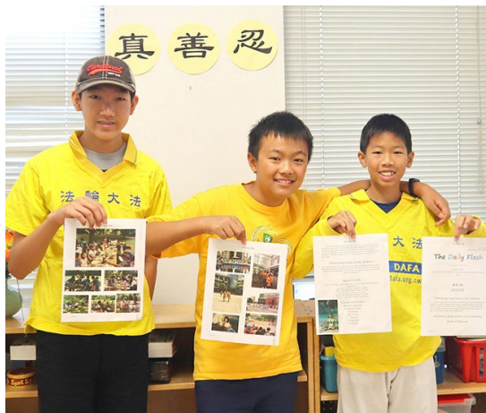
▲ 阿尔伯特（右一）参加真相报纸组的作品。

设有中国舞、书法、国画、素描等课程。学生们表示，通过这次的夏令营课程受益良多，并表示这里的环境非常纯净。期间学校还组织了学生参观在市政厅举办的真、善、忍国际美展。