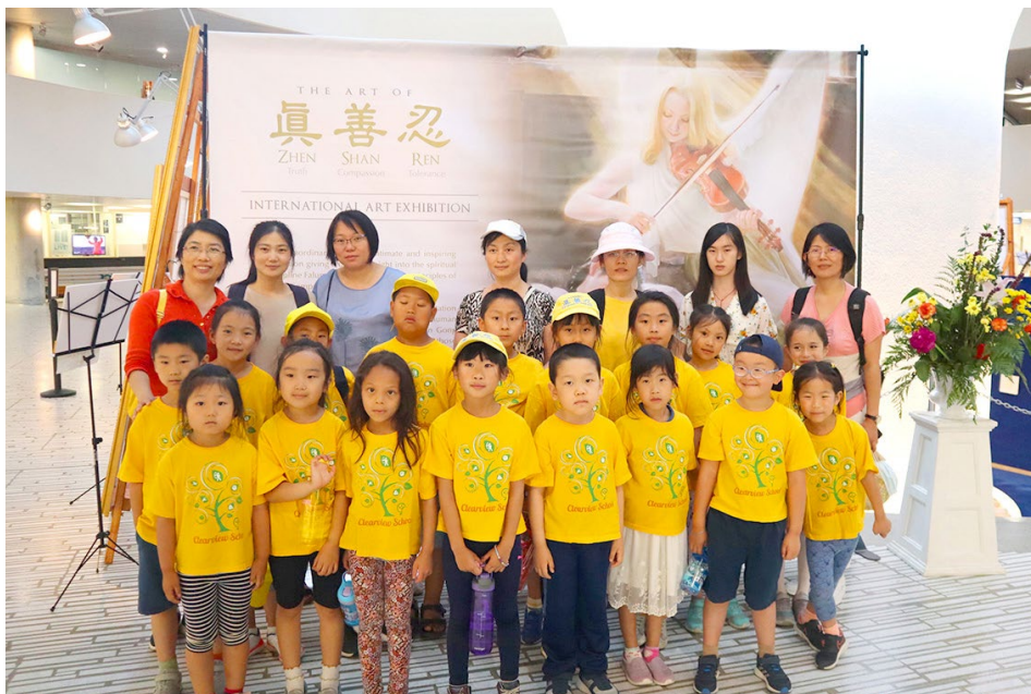
▲ 多伦多明慧学校夏令营带领学生参加真、善、忍美展。