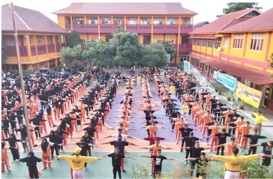
▲ 2022 年 7 月 29 日，法轮功学员在巴淡岛 SMK Negeri 2（国立专业中学 2）介绍法轮功功法。