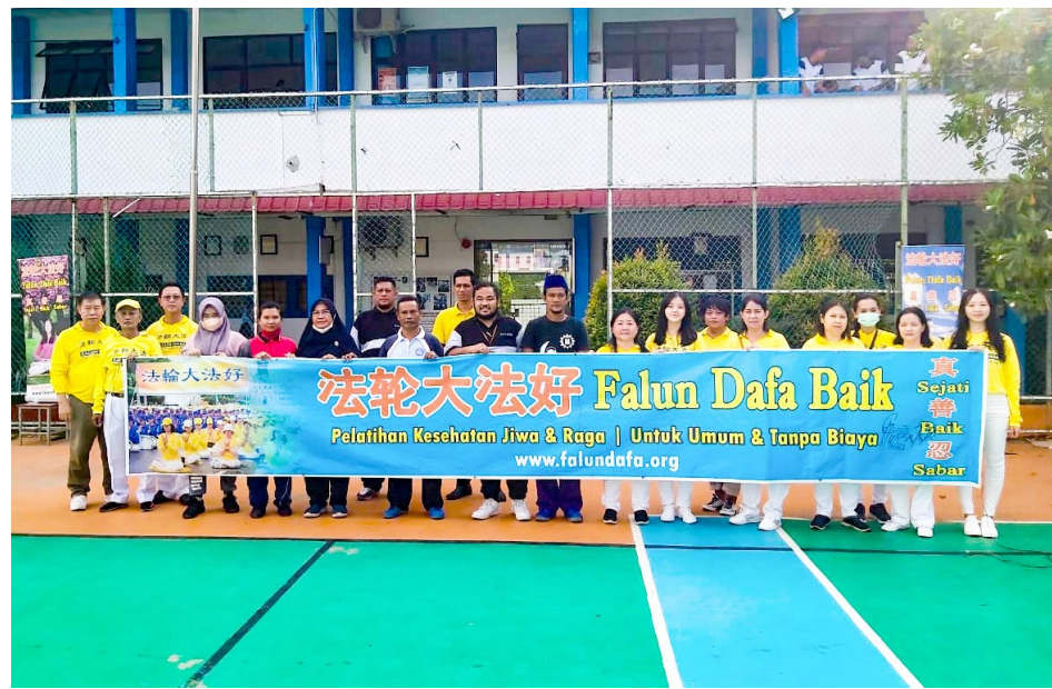
▲ 8 月 13 日，巴淡岛 SMAN 3（国立中学 3）老师们在集体学炼法轮功功法后，与学员一起合影

在每一场活动中，学员首先介绍什么是法轮大法，其真善忍的修炼原则，以及法轮大法的官方网站，包含当地炼功点等信息，然后进行教功。