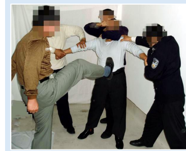
中共酷刑演示图： 拳打脚踢