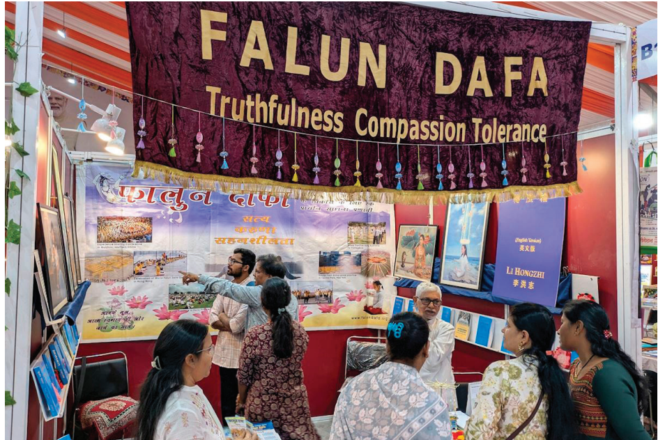
▲ 2025年印度浦那书展上的参观者在法轮大法展位上了解真相。

在法轮大法展位上，学员们展示了大法著作《转法轮》和《法轮功》，并展出了“真善忍国际美展”的部分艺术作品。来自大学、医疗界、艺术界、政界等各领域的参观者，以及众多爱书人士纷纷驻足了解。当得知法轮大法在全球各地均由志愿者无偿教功时，许多人深受触动。大量访客对印度的网上义务教功课程表现出浓厚兴趣，并选购了英文、印地文和马