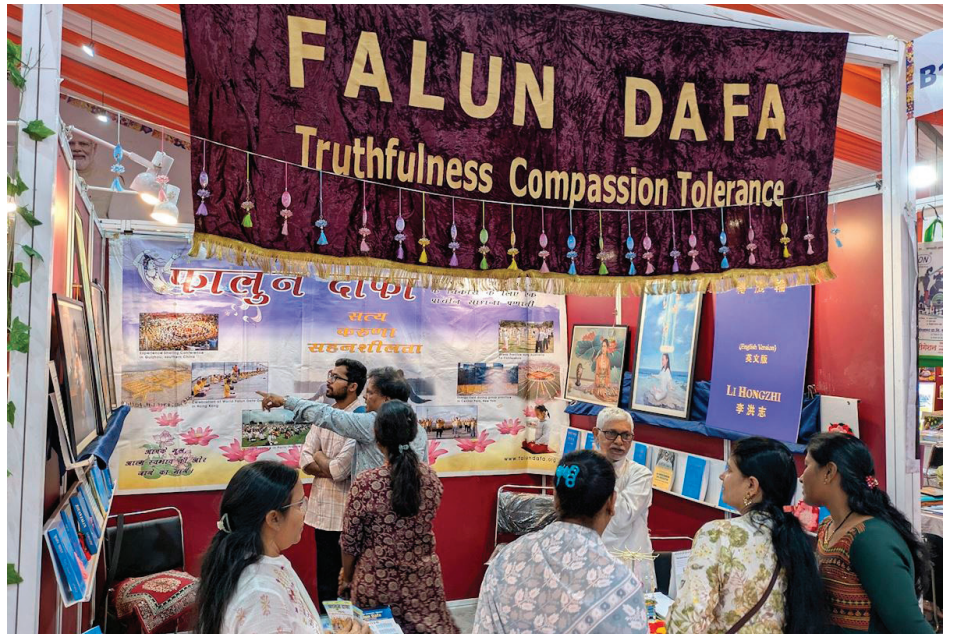
▲ 2025年印度浦那书展上的参观者在法轮大法展位上了解真相。

在法轮大法展位上，学员们展示了大法著作《转法轮》和《法轮功》，并展出了“真善忍国际美展”的部分艺术作品。来自大学、医疗界、艺术界、政界等各领域的参观者，以及众多爱书人士纷纷驻足了解。当得知法轮大法在全球各地均由志愿者无偿教功时，许多人深受触动。大量访客对印度的网上义务教功课程表现出浓厚兴趣，并选购了英文、印地文和马