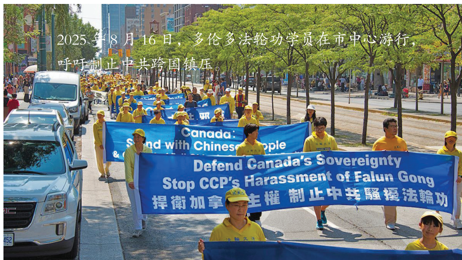
2025年8月16日，多伦多法轮功学员在市中心游行，呼吁制止中共跨国镇压。

在近年来，中共跨国镇压更进一步升级，目标包括法轮功学员及由法轮功学员创立、享誉全球的神韵艺术团。在加拿大及其它民主国家，神韵与法轮功社群遭遇骚扰、假讯息、监控，甚至炸弹与枪击威胁。