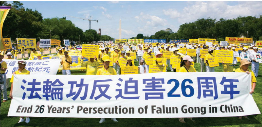
▲ 2025 年 7 月 17 日，部份美国法轮功学员在美国首都举办反迫害集会。

【明慧网】2026 年 1 月 20 日，有关方面通报，中共国家安全部原副部长、中央 610 办公室原副主任高以忱，因涉嫌严重违纪违法，已被取消相关待遇，其涉嫌犯罪问题及相关财物已移送检察机关依法审查起诉。高以忱被起诉实质是因为迫害法轮功遭了恶报。