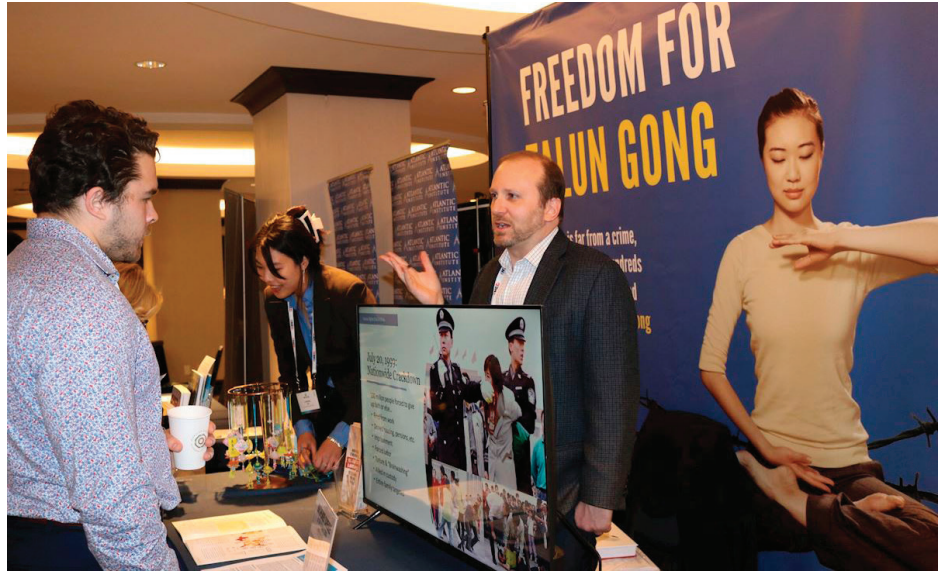
▲2月2日，在国际宗教自由峰会上，与会者在法轮功真相展位前了解真相。

2月4日，在美国国会举行的听证会上，国际宗教自由峰会共同主席萨姆·布朗巴克指出，中共正动用巨额资金与高科技监控，对包括法轮功在内的多个信仰群体展开系统性迫害，他说美国政府应更加公开、明确地声援遭专制政权