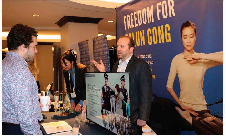
▲2月2日，在国际宗教自由峰会上，与会者在法轮功真相展位前了解真相。

2月4日，在美国国会举行的听证会上，国际宗教自由峰会共同主席萨姆·布朗巴克指出，中共正动用巨额资金与高科技监控，对包括法轮功在内的多个信仰群体展开系统性迫害，他说美国政府应更加公开、明确地声援遭专制政权