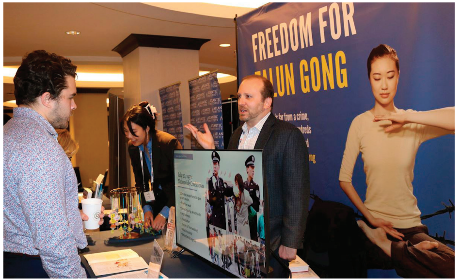
▲2月2日，在国际宗教自由峰会上，与会者在法轮功真相展位前了解真相。

2月4日，在美国国会举行的听证会上，国际宗教自由峰会共同主席萨姆·布朗巴克指出，中共正动用巨额资金与高科技监控，对包括法轮功在内的多个信仰群体展开系统性迫害，他说美国政府应更加公开、明确地声援遭专制政权