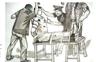
酷刑示意图：弯腰成九十度、灌芥末油、反铐老虎凳并殴打