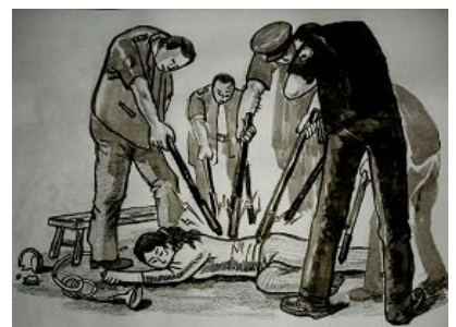
示意图：多根电棍电