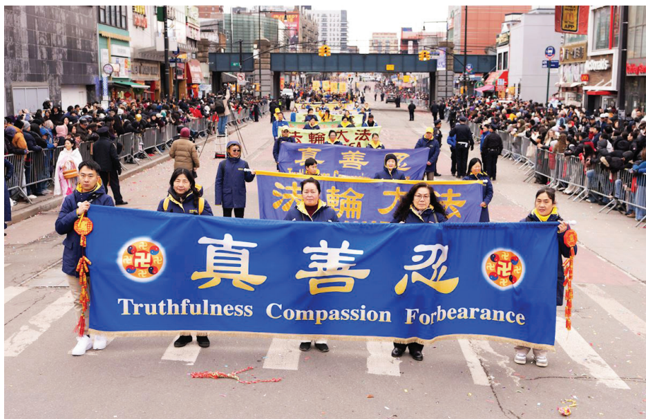
▲2月21日大年初五，法轮功学员参加纽约法拉盛中国新年游行。

大游行的意义在她看来，能使一些从中国大陆来的人看到人们在这里有自由表达的可能，“能在没有政党影响的情况下拥抱文化”。