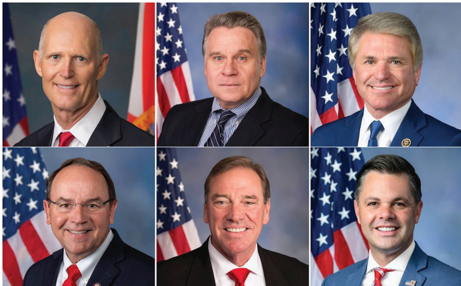
▲ 多位美国国会议员发表声明，向全球的法轮功学员表达敬意。

【明慧网】2026年4月25日，正值万名法轮功学员在北京和平上访27周年。美国首都华盛顿部分法轮功学员于4月11日在中国驻美大使馆前集会，呼吁停止迫害。多位美国联邦参、众议员发表声明支持，强调将持续推动立法追究中共责任。