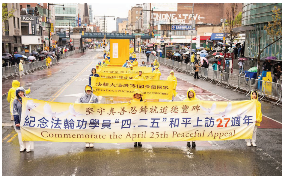
▲ 4月25日，美国纽约法拉盛，法轮功学员举办纪念4·25游行。

据德明州自己介绍，他对法轮功有一个认识过程，从一开始不太了解，到后来听说活摘器官，以及看到身边善良