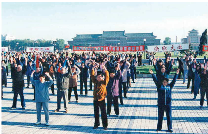
▲ 1998年5月15日，长春文化广场法轮功学员万人炼功。

【明慧网】我的亲家母是一位中医大夫，从医一辈子不知挽救了多少患者，救了多少人的生命，到老了自己的身体却是一团糟，什么病都有。根据她自己从医的经验，她给自己治病，无论怎样对症下药，都是疗效甚微，有的还越来越重。用她自己的话说，我这辈子不知治好了多少个我这样的病人，如今给自己治怎么都治不好了呢。这个，用她的科学头脑怎么也解释不了。