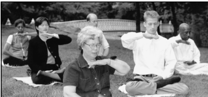
Harjoittajat kaikkialla maailmassa, jotka ovat etsineet totuutta ihmisestä ja elämän tarkoituksesta, ovat löytäneet Falun Dafasta vastauksen elinikäiseen etsimiseensä.

Monimutkaiset olosuhteet jokapäiväisessä elämässä ja yhteiskunnassa antavat harjoittajalle parhaimmat mahdollisuudet kohottaa sydämen luonnettaan ja moraaliaan (Xinxing).