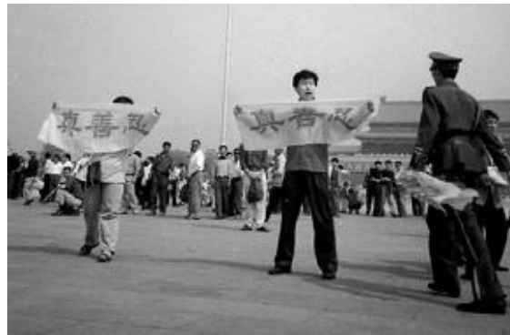
Utövare håller upp tecknen Sanning, Medkänsla, Tolerans. För detta arresteras de, hotas till livet, och i många fall torteras de till döds.