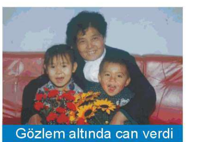
Gözlem altında can verdi