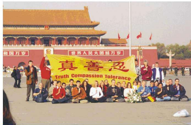
21 Kasım 2001'de 36 kişilik Avrupalı uygulayıcı grubu Çin'e gitti ve Tiananmen'de 4 dk içinde gözaltına alındı.