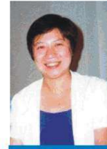
Öğretim üyesi hayatını kaybetti