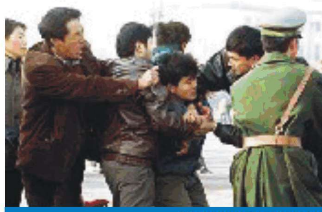
Tiananmen Meydanında uygulayıcılar gözaltına alındı