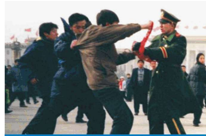
Tiananmen Meydanında uygulayıcılar gözaltına alındı