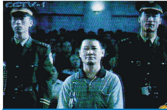
Bu uygulayıcı 18 yıl hapis cezasına çarptırıldı

22 Haziran 1999 sonrasında Çin tarafından engellenmeye başladı