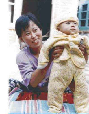
8 aylık çocuk ve annesi hayatını kaybetti

Uygulayıcıların Katledilmesine Son Verin !