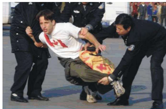
Aynı gün gözaltına alınan bir Kanada'lı Falun Dafa'yı savunuyor