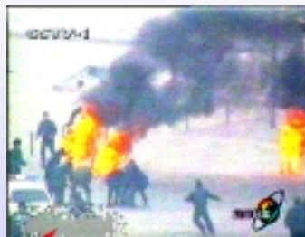
这里，中央电视台又在干什么呢？