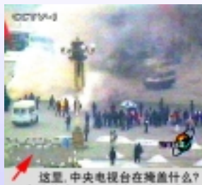
这里，中央电视台在掩盖什么？又有谁能跑到比天安门灯杆还高的地方去摄影呢？