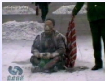
他怎么就坐得住呢？为什么就不怕痛呢？